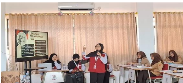
Gambar 3. Pemaparan Materi