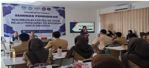
Gambar 2. Pembukaan oleh MC