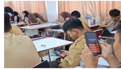
Gambar 4. Pengerjaan Quiz