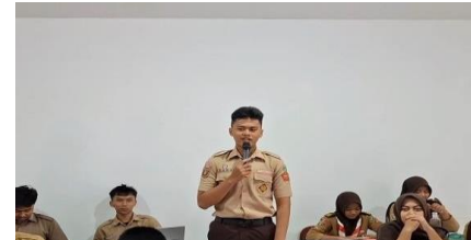
Gambar 5. Sesi tanya jawab